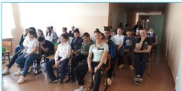
Соревнования по волейболу